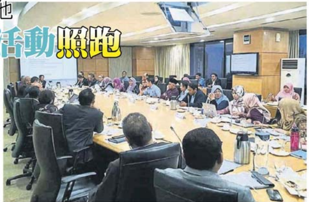
■吉隆坡市政局各项会议照常举行。