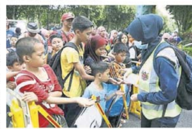
■莎阿南市政厅在举行大型户外活动时，也采取预防措施，包括让出席者使用消毒手液。

■原定於3月8日在八打灵再也举行的2020年大馬女性馬拉松（MM）活動，也因武漢肺炎疫情的擴散而取消。