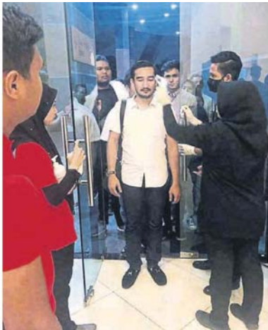
■莎阿南市政厅为访客测量体温，包括提供消毒手液。