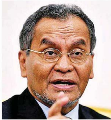
祖基菲里阿末已经答应，代领雪州抗疫行动小组。

(吉隆坡 10 日讯) 基于 6 成我国新冠肺炎确诊病例来自雪兰莪，雪州大臣拿督斯里阿米鲁丁周二宣布委任前卫生部长拿督斯里祖基菲里阿末代领抗疫行动小组，应对日益严重的新冠肺炎疫情。