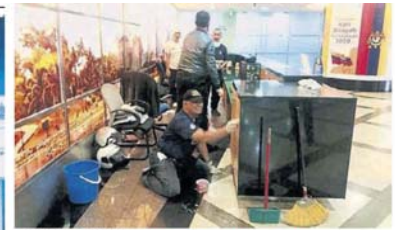
↑吉隆坡市政局在日前在总部举行大扫除活动，包括在公共区域进行消毒。