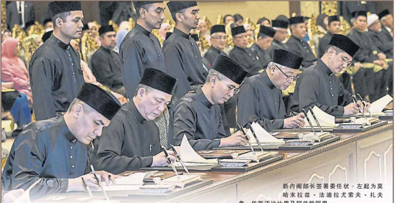
新内阁部长签署委任状。左起为莫哈末拉兹、法迪拉尤索夫、扎夫鲁、依斯迈沙比里及阿兹敏阿里。