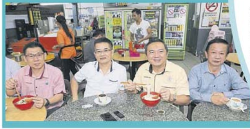
▲黄思汉(右2)带队到美食中心，为近日网传的消息辟谣。

蒲种金宝区州议员兼雪州行政议员黄思汉劝告蒲种区的居民和民众不要担忧，尤其是针对最近在社交媒体中狂传的武汉肺炎消息，因为有一部分是假消息。 黄思汉接受《中国报》记者询问时说，卫生部所采取的措施证明了能有效控制疫情，所以大家无须过于担忧，而是需要跟著卫生部的指南处理。 他在近期确实有接获许多居民和商家的询问及投诉，其中有部分声称买不到口罩、口罩价格太高等。 他也劝告居民要查询卫生部网站及得到最新资讯，并根据指南做好防范措施等。 他说，我国面对口罩缺货的其中一个原因，是有厂商为了赚取更高盈利，把口罩出口到国外。 “之前已向国内贸易及消费事务部反映，政府是有需要禁止口罩出口，及管制在网上售卖，其价格是比市场价贵出几倍，希望新中央政府能继续关注此课题。” 他建议当局应考虑提高口罩的顶价，因为全球都在抢购口罩或口罩原料，价格上涨。所以厂商卖出国以赚取更高盈利，零售商也不敢从外国进货，因为成本远远超过顶价，如果所售卖的口罩价格超过顶价也是属于违法的行为。